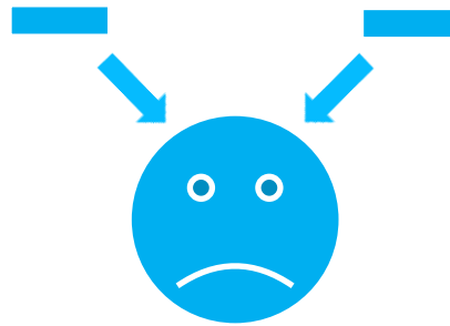
Konflikt dvou záporných cíů